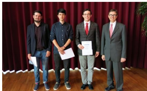
Preisverleihung für die besten Absolventen der Meisterschule und des Berufskollegs